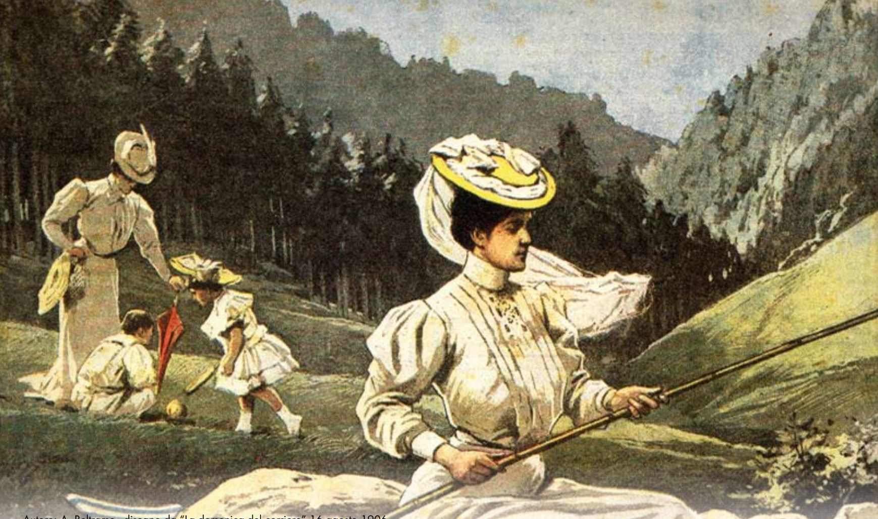
Autore: A. Beltrame - disegno da "La domenica del corriere" 16 agosto 1906 Torrente Gesso a Sant'Anna di Valdieri (Valdieri CN) "Gli svaghi della famiglia Reale in Valle Gesso: la Regina Elena alla pesca"